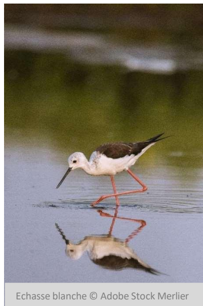
Echasse blanche