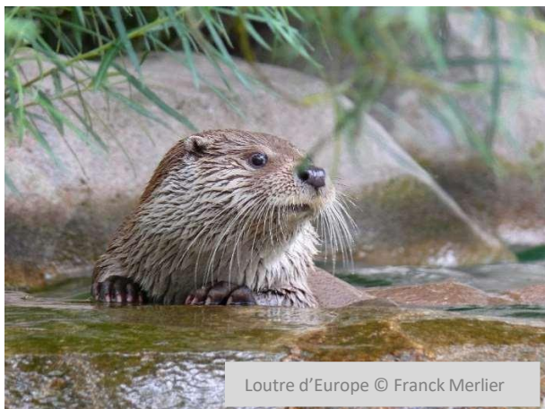
Loutre d'Europe