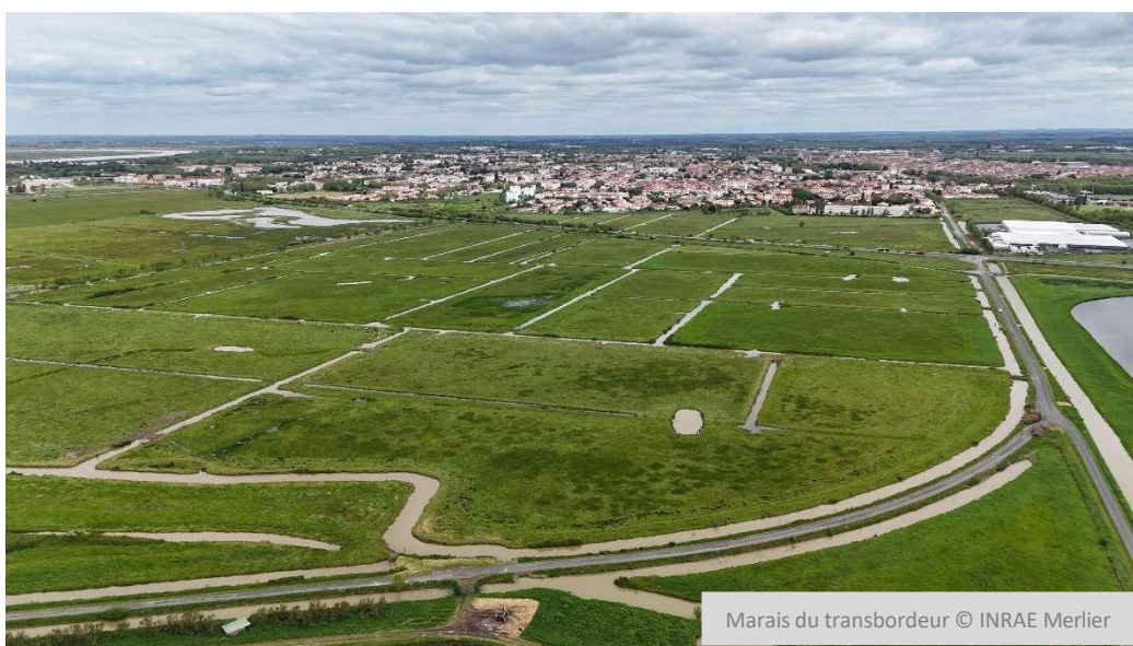
Marais du transbordeur